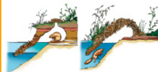
Doorsnede van twee types beverburchten tegen een oever

Er is nog een situatie waarbij bevers in dijken kunnen graven, namelijk tijdens hoogwaters. Als tijdens hoogwater de uiterwaarden onderlopen, kunnen bevers hun hopen en burchten niet meer gebruiken. Ze kijken dan uit naar hoogwatervluchtplaatsen, zoals oude steenfabriekterreinen en andere punten die nog boven het water uit steken. Daarbij is het van belang dat dergelijke plaatsen enige rust kennen. Met name verstoring door mensen en honden zorgt ervoor dat bevers eventuele hoogwatervluchtplaatsen niet kunnen gebruiken. Zijn er geen geschikte hoogwatervluchtplaatsen dan wordt de kans groter dat bevers halverwege het dijktafval onder de waterlijn hopen graven. Ook deze situatie is ongewenst omdat de stabiliteit van de dijk in gevaar komt.