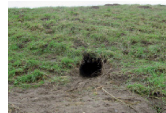
Ingang van beverhol halverwege een dijklichaam, gegraven tijdens hoogwater.