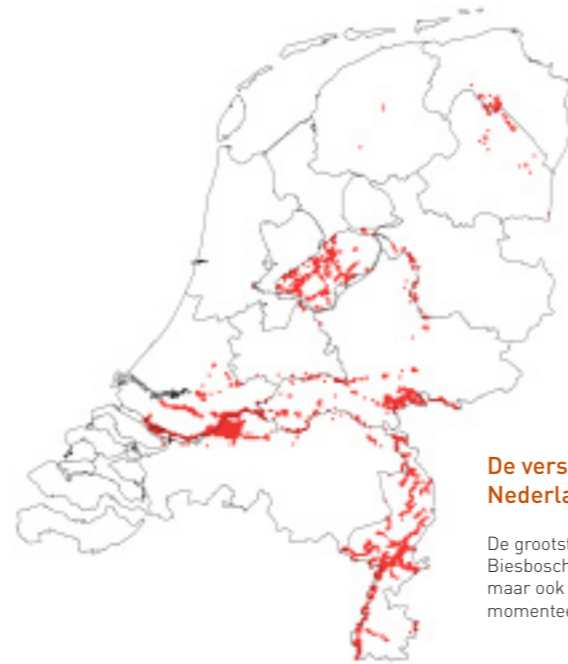
De verspreiding van de bever in Nederland in de periode 2007-2012

Overlast voorkomen of oplossen Bevers zijn beroemd om hun vermogen om bomen om te knagen en dammen te bouwen. Al deze gedragingen kunnen ook overlast veroorzaken. Zeker als ze in de nabijheid van menselijke activiteit plaatsvinden en dat is in Nederland al zeer snel het geval. Nu de bever in steeds meer gebieden voorkomt (zelfs in steden zoals Dordrecht, Roermond, Almere en Gouda!) en de dichtheden toenemen is de kans dat er overlast ontstaat ook steeds groter. Om de huidige positieve houding ten opzichte van de bever in stand te houden is het noodzakelijk om tijdig deze problemen te onderkennen en er aandacht aan te schenken. Deze folder behandelt de belangrijkste gedragingen van bevers waaruit overlast kan ontstaan. Daarbij wordt ook aandacht gegeven aan mogelijke oplossingen om overlast te voorkomen of zoveel mogelijk te beperken.